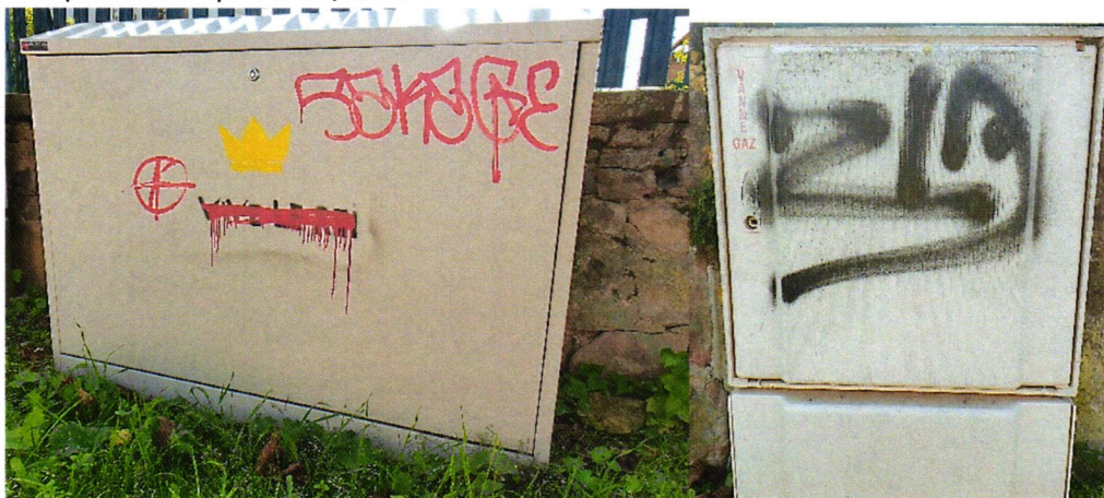
Avenue de Gail – Photo 10/2020