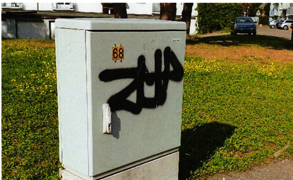
Rue du Gal Leclerc – photo 10/2020