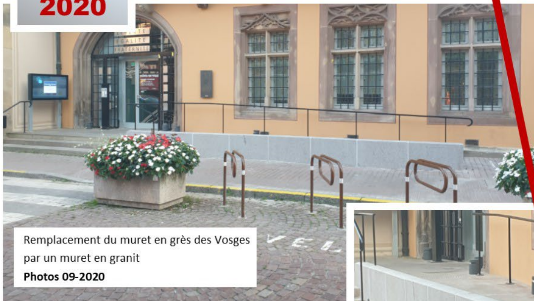
Remplacement du muret en grès des Vosges par un muret en granit Photos 09-2020