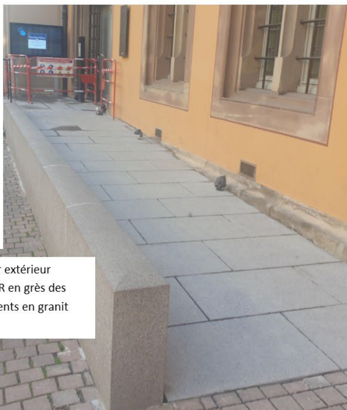
Remplacement de l'escalier extérieur et de la rampe d'accès PMR en grès des Vosges par des aménagements en granit Photos 01-2023