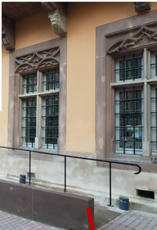
Nouvel accès à l'hôte de ville Escalier et rampe PMR en grès des Vosges Photos 06-2019